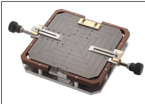
Vakuumaufnahme 6x6" mit mechanischer Klemmung