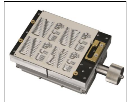
4x4" Substrataufnahme m. gummierter Oberfläche, mit mechanische Klemmung