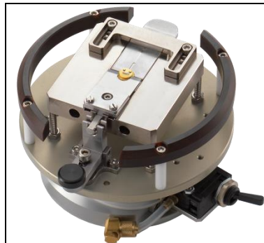
TO Aufnahme mit mechanischer Klemmung