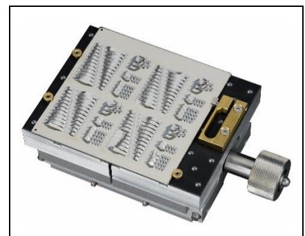
4x4" Substrataufnahme m. gummierter Oberfläche, mit mechanischer Klemmung